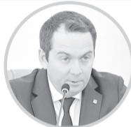
Андрей Чибис, Губернатор Мурманской области:

Параллельно ведется ямочный ремонт. Выявлено 0,3 тыс. кв. м дефектов на федеральных дорогах, 4 тыс. кв. м – на региональных и 15,4 тыс. кв. м – на местных. Устранено 100% дефектов на федеральных дорогах, 33% – на региональных и 43% – на местных. Ямочный ремонт завершен в Кандалакшском, Ловозерском и Печенгском округах, в городах Мончегорск, Оленегорск, Полярные Зори, а также в ЗАТО Заозерск и Видяево.